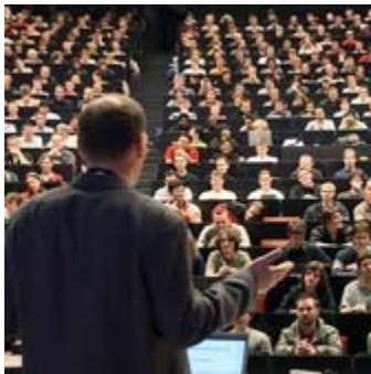
Professor unter Bewertungsdruck: Forscher streiten über die Aussagekraft von Rankings.

Kontrovers haben die deutschen Professoren für Betriebswirtschaftslehre auf ihrer Jahrestagung in Nürnberg über den Sinn und die Aussagekraft wissenschaftlicher Rankings diskutiert. Unter anderem, weil das Handelsblatt kurz vor der Tagung umfassende Ranglisten zur Forschungsleistung von BWL-Professoren und-Fakultäten veröffentlicht hatte.