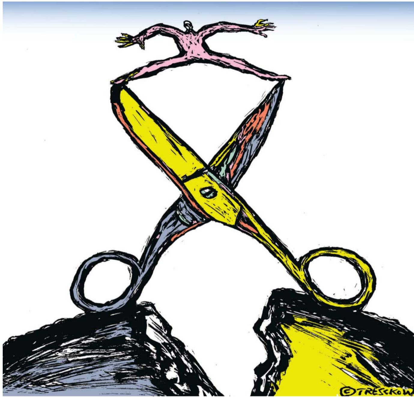
Illustration Peter von Tresckow

Wenn man aber die Einkommensverteilung innerhalb der einzelnen Länder betrachtet, sieht es anders aus. Atkinson hat große Mengen an historischen Daten über die OECD-Staaten zusammengetragen, die einen U-Verlauf – also sinkende, dann aber steigende Ungleichheit im zwanzigsten Jahrhundert zeigen, wobei